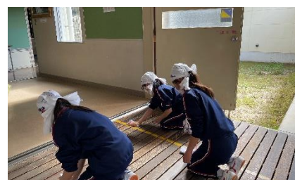
1年生への清掃指導