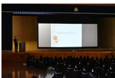
生活オリエンテーション