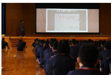
学習オリエンテーション